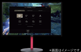
*画面はイメージです。

PCからモニターの設定を操作できる専用アプリ「Acer Display Widget」で、お好みのカスタマイズを。カラーの詳細調整、ゲーム特性に合わせた表示モード、画面の分割など、各種設定が可能です。