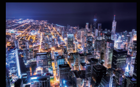
VESA DisplayHDR™ 400対応