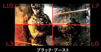
ブラック・ブースト

ジャンルに応じて最適な映像モードを8種類から選べる「Game View」機能や、黒の強弱を11段階に調節して暗がりでの視認性を高める「ブラック・ブースト」機能など、ゲームタイトルに合わせて最適な環境で楽しめます。