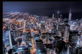
VESA DisplayHDR™ 400非対応

リフレッシュレート165Hzに対応。さらにAdaptive-Sync対応により、表示遅延やカクツキのない安定したゲーム環境に。瞬間の動きが決め手となるゲームも、ストレスなく楽しめます。