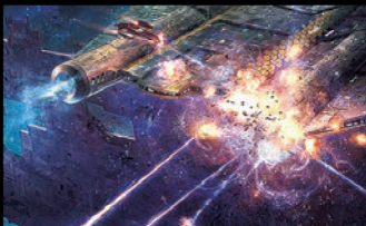
グラフィックス性能が高い場合