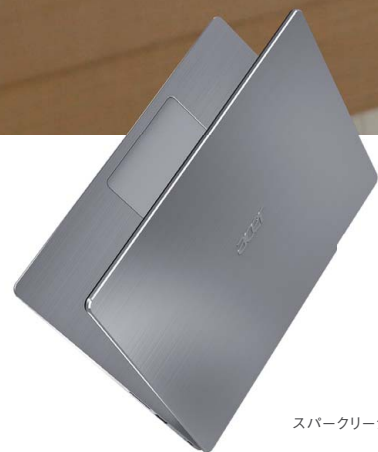
スパークリーシルバー

スタイリッシュなスリムボディに、力強いパフォーマンスを詰め込んで。 映像編集などのクリエイティブワークはもちろん、 幅広いシーンでパワーを発揮。充実の高機能で、使い方が広がります。