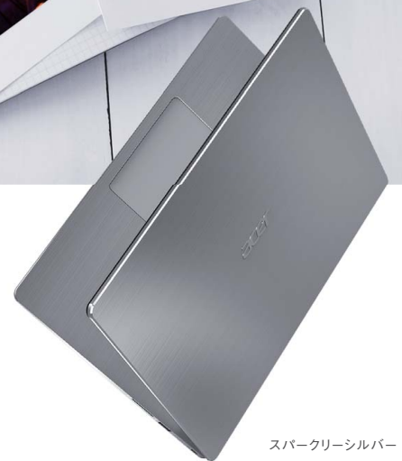
スパークリーシルバー

クールな外観を演出するアルミニウム素材採用のボディ。指紋認証でスマートログイン。いつものカフェで、図書館で、自宅のリビングで。お気に入りの場所で思いのままに楽しめます。