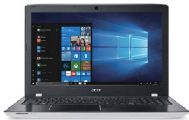
E15 E5-576-F78G/W E5-576-F58G/W