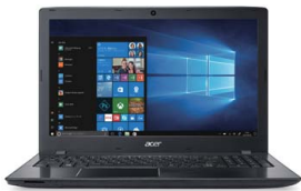
E15 E5-576-F78U/K E5-576-F58U/K